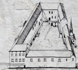
1814. – 1820. g.