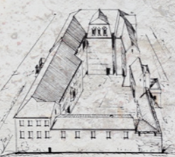
1909. – 1914. g.