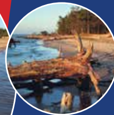
Kolkasrags apmeklētāju un informācijas centrs