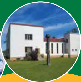
Lībiešu tautas nams Mazirbē Livonian House in Mazirbe